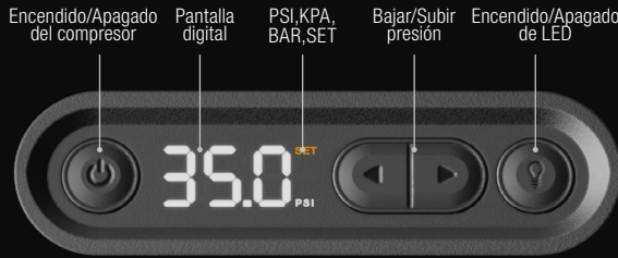
Encendido/Apagado del compresor Pantalla digital PSI, KPA, BAR, SET Bajar/Subir presión Encendido/Apagado de LED