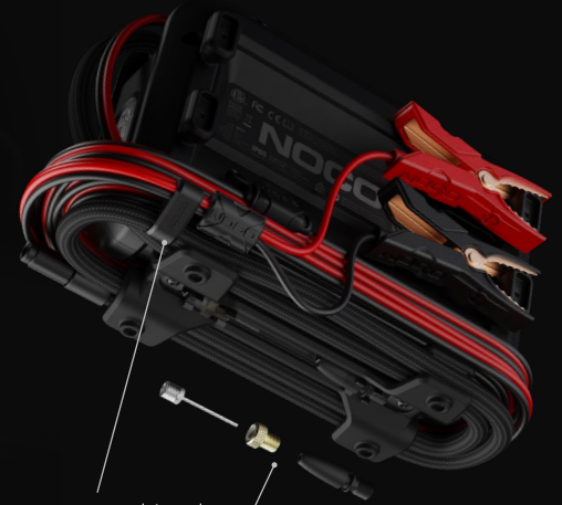
Pinza para manguera integrada Adaptadores