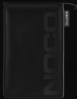
Bolsa de microfibra para almacenamiento

Compresor de aire portátil AIR20 con manguera entretrejida de 3 ft (91 cm) y cable de alimentación de 20 ft (6 m) + abrazaderas