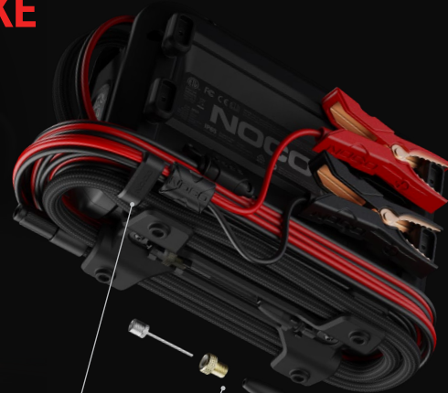
Integrovaná hadicová spona