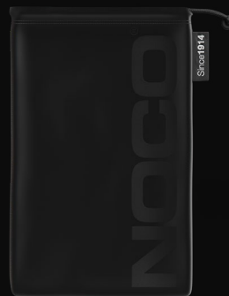
Custodia in microfibra

Guida utente e informazioni sulla garanzia