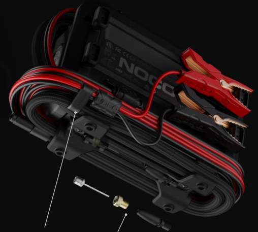
Clip de tuyau intégré