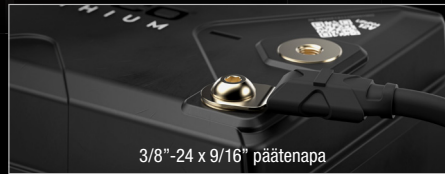
3/8"-24 x 9/16" päätenapa

NLX-liitännät tarjoavat monipuolisia vaihtoehtoja, jotka sopivat tarpeisiin eri käyttötarkoituksissa.