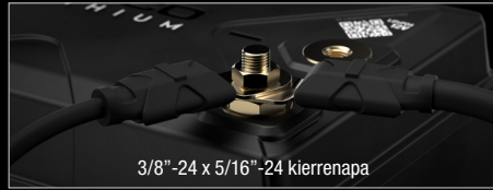
3/8"-24 x 5/16"-24 kierrenapa