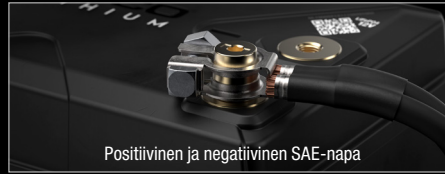
Positiivinen ja negatiivinen SAE-napa